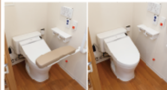
▲前方ボード使用時

前方ボード(はね上げタイプ)・ペーパーホルダー・排泄しやすい前傾姿勢を支える前方ボードを設置いたしました。お一人でゆっくりとご使用いただけます。また、ペーパーホルダーは60kgの重さに耐えられるため、手番りとしてお使いいただけます。