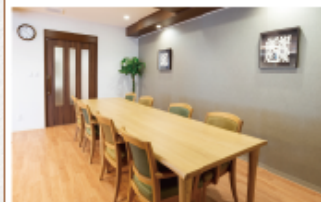
▲ファミリーダイニング