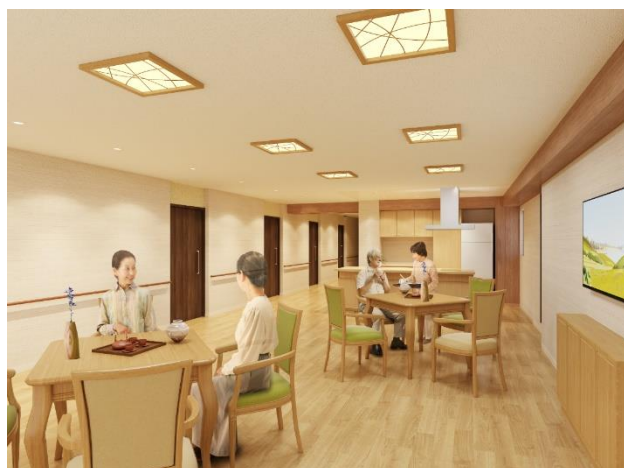
< リビングスペース >