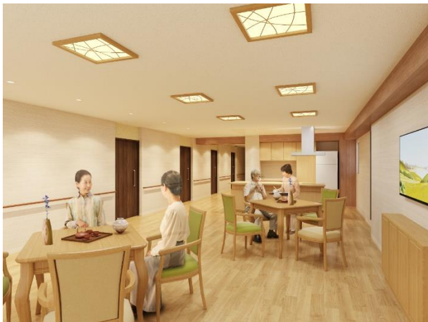
< リビングスペース >