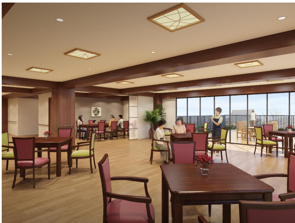
< 西新井大師を望む 5階ダイニング >