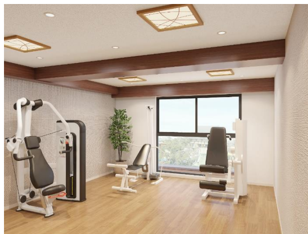
< リハビリスペース >