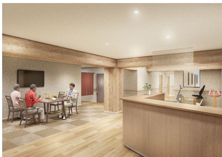
<リビング(談話スペース)>