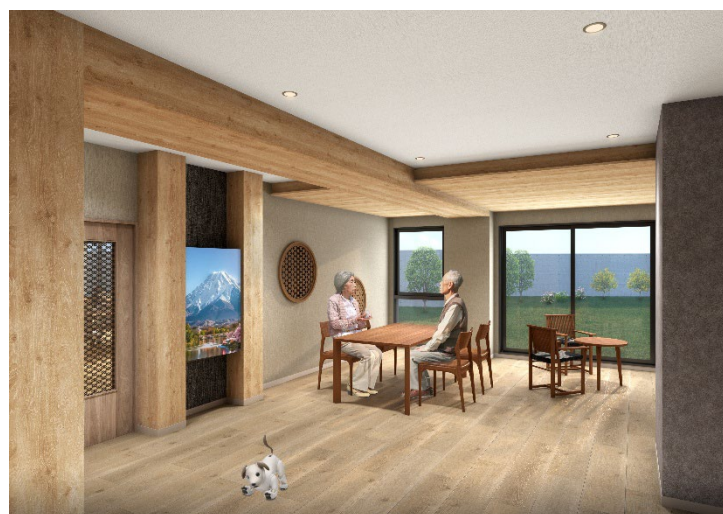
<エントランス ラウンジ>