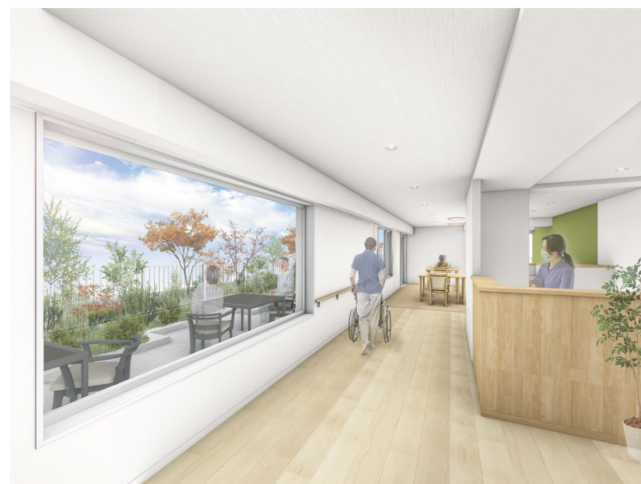
< 5階 リビング(談話スペース)・ルーフバルコニー >