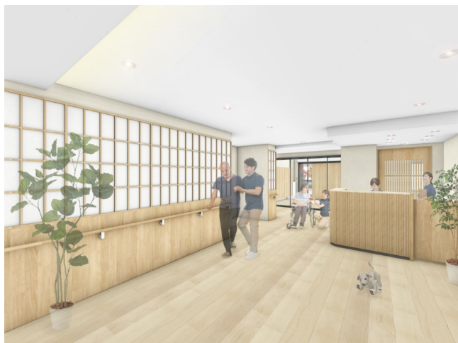
< エントランス >