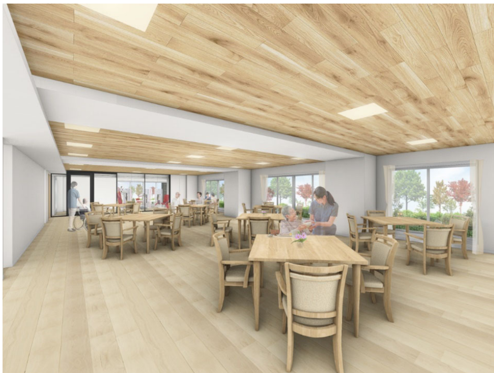
< ダイニング(食堂) >