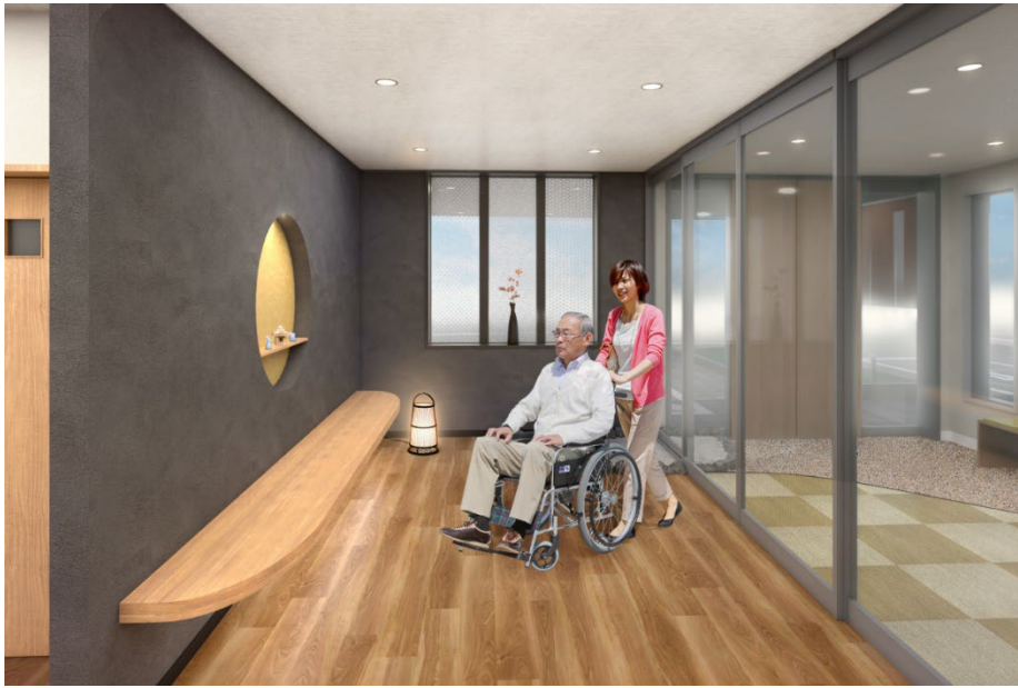
< エントランス >