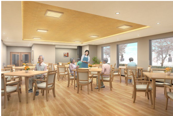
< ダイニング(食堂) >