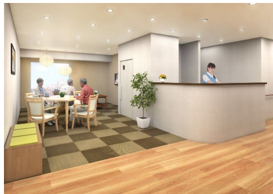
< リビング(談話スペース) >